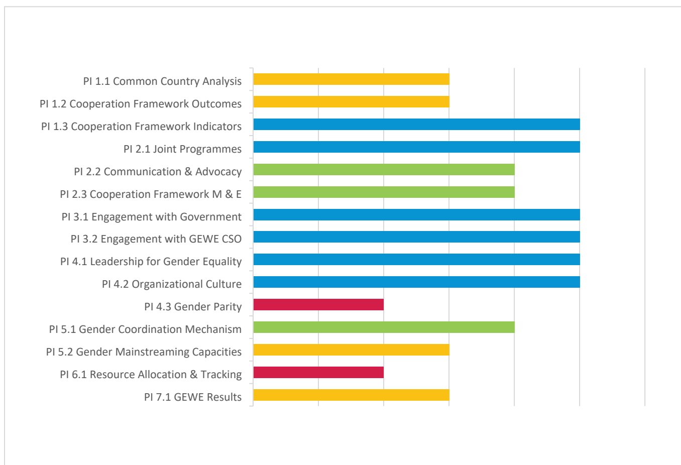
Table 1: Guinea UNCT-SWAP Results in 2022

■ Missing requirements ■ Approaches minimum requirements ■ Meets minimum requirements ■ Exceeds minimum requirements